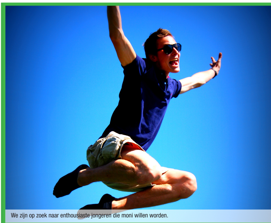
We zijn op zoek naar enthousiaste jongeren die moni willen worden.

Benieuwd naar de activiteiten? Kijk dan op www.anzegem.be/tieners .