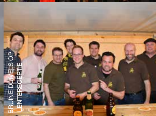
BRUINE DJUVELS OP LENTERECEPTIE