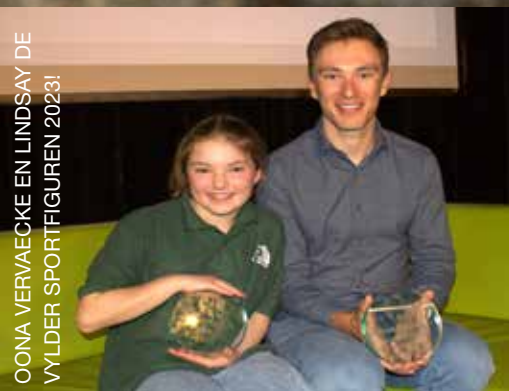
OONA VERVAECKE EN LINDSAY DE VYLDER SPORTFIGUREN 2023!