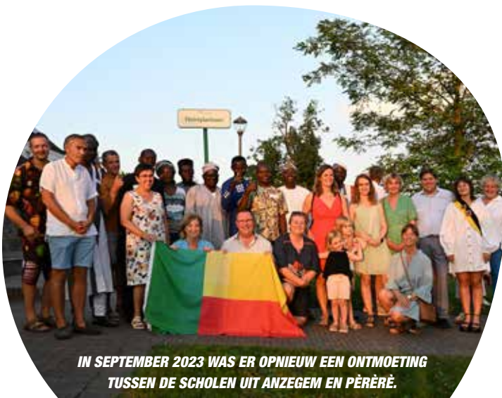
IN SEPTEMBER 2023 WAS ER OPNIEUW EEN ONTMOETING TUSSEN DE SCHOLEN UIT ANZEGEM EN PÈRÈRÈ.