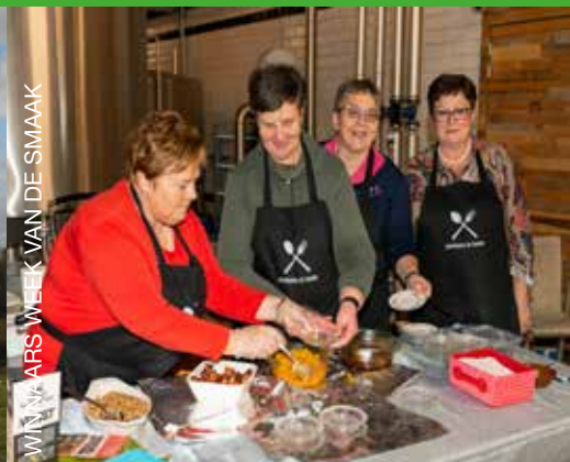
WINNARS WEEK VAN DE SMAAK