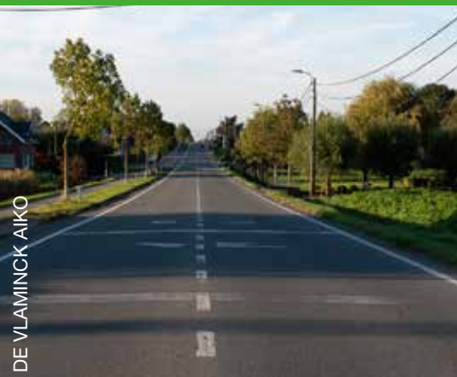
DE VLAMINCK AIKO