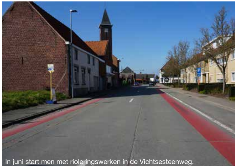
In juni start men met rioleringswerken in de Vichtsesteenweg.

Voor 7u en na 16u, tijdens de verlofdagen en het weekend zal men alle signalisatie wegnemen en kan er overall doorgereden worden. De werken zullen tot begin 2023 duren.