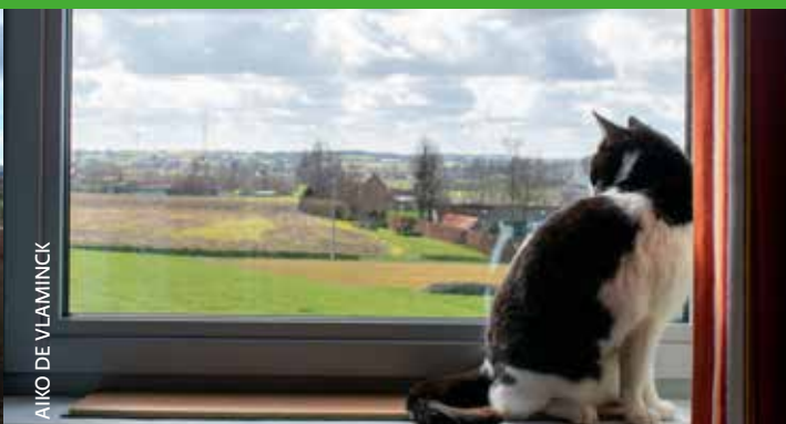
AIKO DE VLAMINCK