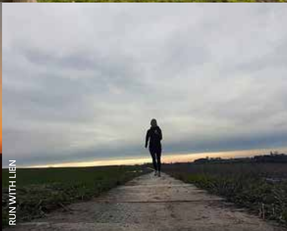
RUN WITH LIEN